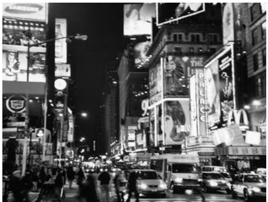
De reclamewereld heeft haar globale centrum in New York.

De 123 steden in Taylors datamatrix vertonen tekenen van globalisering via de aanwezigheid van kantoren van geglobaliseerde dienstverleners. Het aandeel hoofdsteden is vierenvestig procent. Dit is hoog, want er zijn maar 191 staten naar het criterium van het VN-lidmaatschap, waaronder tientallen dwergstaten en staten die in het ongereede zijn geraakt. Hoofdsteden hebben dus binnen de verzameling van alle steden algemeen gesproken een grote kans om in processen van globalisering betrokken te raken. Kijken we naar de verdeling van connectiviteiten via het patroon van vestigingen van de honderd firma's en hun veronderstelde verbindingen, dan hebben de hoofdsteden een niet minder centrale positie dan de overige globaliserende steden. Onder de vijftientig meest centrale steden is het percentage hoofdsteden eveneens vierenvestig. Hieronder vallen niet-hoofdsteden als New York, Hong Kong en Frankfurt, maar ook Londen, Tokyo en Parijs. Onder de minst centrale steden zijn veel