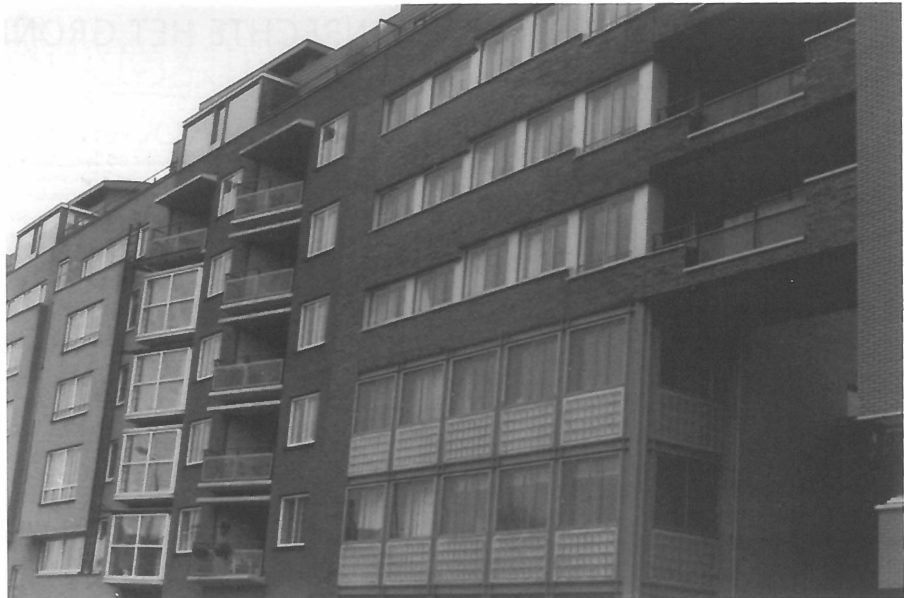
Afwisseling in kleurgebruik.

latie tussen stedenbouw en gedrag. Daarbij komt dat van de idealistische motieven van de New Urbanists in de praktijk weinig overblijft. De ideeën vinden vooral aftrek bij welgestelde Amerikanen die het geld hebben om zich sociaal te profileren door middel van hun woonomgeving. De roep om diversiteit in bevolkingssamenstelling is een boodschap richting overheid en publiek, maar wordt in de praktijk niet nagestreefd.