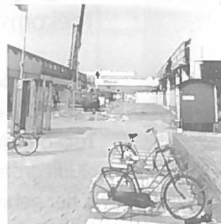
Fietsvriendelijke nieuwbouw.

Cahiers is eind vorig jaar de studie De openbaar vervoer- en fietsvriendelijke woonwijk: tussen droom en werkelijkheid verschenen. Deze studie naar de mogelijkheden voor en problemen bij de toepassing van een openbaar vervoer- en fietsvriendelijke wijkinrichting vertrekt vanuit de constatering dat de huidige bijdrage van het ruimtelijk beleid te eenzijdig gericht is op de bestemmingsgebieden van verplaatsingen, zoals lokaties voor bedrijven en voorzieningen. Door ook het ontwerp van nieuwbouwkolaties te beschouwen als een instrument voor de geleiding van mobiliteit, kan deze bijdrage geoptimaliseerd worden. Het onderzoek heeft resulterend in een ideaal-typisch model voor een openbaar vervoer- en fietsvriendelijke, auto-arme woonwijk. Bovendien zijn de oorzaken van de huidige kloof tussen de praktijk vanuit verschillende invalshoeken -waaronder stedenbouwkundige ontwerpproblemen- en de invloed van (toekomstige) sociaal-economische factoren op het verplaatsingspatroon. De studie eindigt met een aantal aanbevelingen voor de rea-