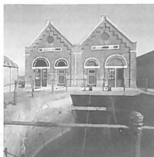
Industrieel erfgoed te veel ondergewaardeerd.

1996 wordt het Jaar van het Industrieel Erfgoed . Het hele jaar door zal een groot aantal activiteiten worden georganiseerd met als doel het erkennen van het industrieel erfgoed als een wezenlijk onderdeel van de recente cultuurgeschiedenis van Nederland. Volgens de special in het leven geroepen stichting '1996 Jaar van het Industrieel Erfgoed' is de publieke waardering voor fabrieken, watertorens, stoommachines en dergelijke in het algemeen lager dan die voor kastelen, kerken en boerderijen. Als gevolg daarvan zijn veel unieke objecten verloren gegaan, en dat terwijl zij een