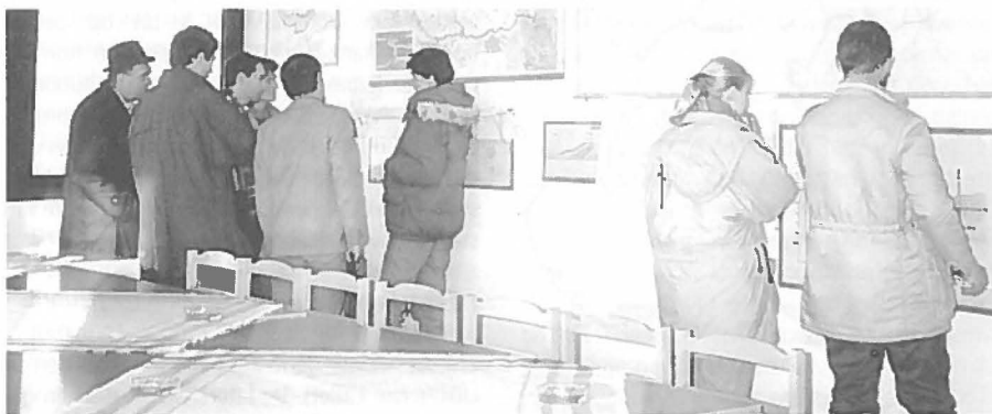
Intergemeentelijke samenwerking aanleiding voor veel nieuwe contacten.

Binnen de organisatie van de Intersetlement Union ligt de nadruk op de vrijwillige deelname van de gemeenten. Het democratisch gehalte is erg hoog. Dit uit zich onder meer in de aanwezigheid van veel overlegmomenten in de planings- en besluitvormingspaden en de mogelijkheid tot inspraak door de bevolking door middel van fora. In de praktijk blijkt samenwerking op de nodige hindernissen te stuiten. De samenwerking in deze regio is nog niet toe aan dit democratisch samenwerken. De belangrijkste problemen die hierin een rol spelen zijn terug te voeren op een gebrek aan vertrouwen. Ten eerste is er een gebrek aan vertrouwen tussen de gemeen-