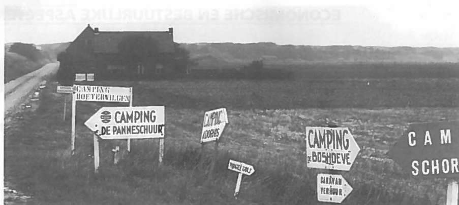
Verbrede ontwikkelingen.

Dit neemt niet weg dat wel een aantal categorieën bestuurlijke problemen zijn te onderscheiden. Eén zo'n categorie kan worden getypeerd als 'doorwerkingsproblemen'. Meestal brengen medewerkers van ministeries deze categorie naar voren. De besluitvorming over het ruimte-