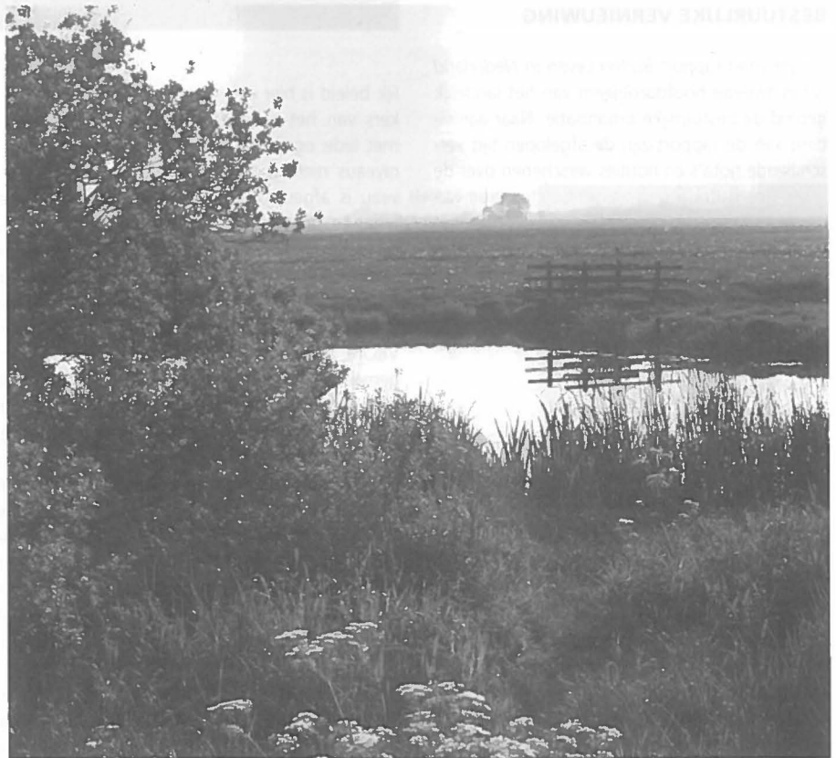
Bestuurlijke problemen op het platteland worden nauwelijks gezien.

genheid in de land- en tuinbouw meest sombere scenario (dat wat betreft economische groei overigens het meest gunstig uitpakt) daalt het aantal voltijdse banen in de agrarische sector van 225.000 begin jaren negentig tot 125.000 in het jaar 2015. Dat is een afname van ruim twee procent per jaar. Daar staat tegenover dat er ook een scenario is waarin de werkgelegenheid in de landbouw tot 2015 'maar' met zo'n 25.000 banen daalt (-0,5 procent per jaar). Dit scenario is macro-economisch echter duidelijk ongunstiger, en zal derhalve minder snel nagestreefd worden door beleidsmakers. Zijn een paar duizend agrarische banen wel voldoende om zo'n drukte over te maken? Daar kan het volgende over worden gezegd. Op de eerste plaats is al aangegeven dat elke baan in de land- en tuinbouw een baan elders creëert. We hebben het dus niet over 25.000 of 125.000 banen die verdwijnen, maar over 50.000 respectievelijk 250.000 (afhankelijk van het scenario). Op de tweede plaats is in een aantal regio's het aandeel van de werkgelegenheid op land- en tuinbouwbedrijven in de totale werk-