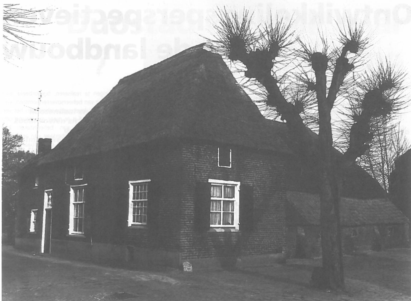
Een Gelderse boerderij in Batenburg.

ning op het erf (zes situaties); - de schoonouders verhuizen naar het dorp (drie situaties).