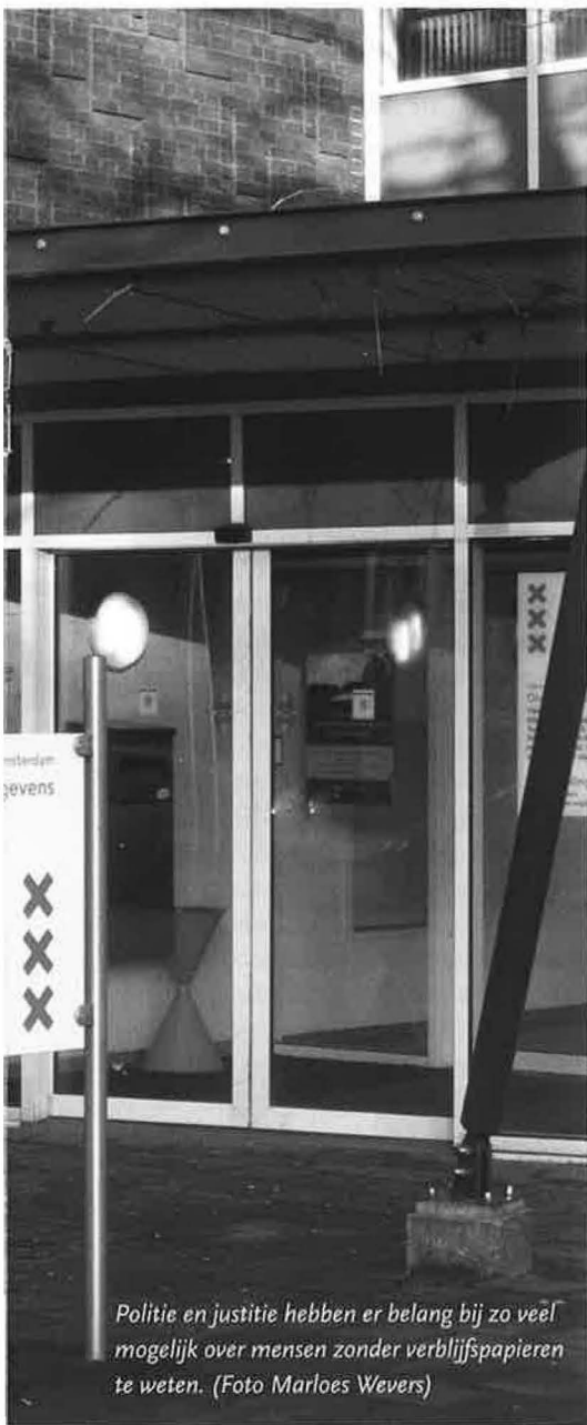
Politie en justitie hebben er belang bij zo veel mogelijk over mensen zonder verblijfspapieren te weten.

wordt dit herhaald, op een andere willekeurige plaats in het meer. Op basis van het aantal vissen dat alleen op het eerste tijdstip is gevangen, het aantal dat alleen op het tweede tijdstip is gevangen en het aantal dat beide keren is gevangen, valt het aantal vissen te schatten dat beide keren niet is gevangen. De som van deze getallen geeft een schatting van het totale aantal vissen in het meer. Deze rekenmethode is in aangepaste zin bruikbaar voor het schatten van het aantal illegale migranten." De sociologen, politicologen en antropologen blijken biologen te zijn geworden. Vandaar ook dat ze 'illegalen' als vlinders opprikken en ontleden.