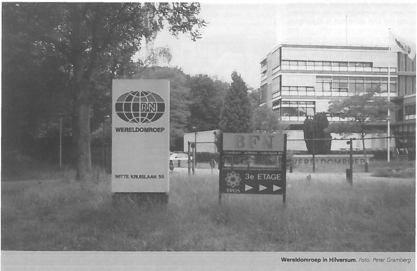
Wereldomroep in Hilversum.