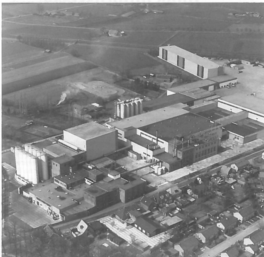
Vestiging te Groenlo, deuren sluiten in 2003.

Ondanks alle emotionele reacties ziet Grolsch de verhuizing als een blijk van vertrouwen in de eigen toekomst. Met de beoogde investeringen drukt de directie van Grolsch meteen alle geruchten de kop in dat de brouwerij overgenomen zou worden door een ander, groter concern. Men mikt duidelijk op een eigen, zelfstandige positie met een grotere capaciteit. Dit is natuurlijk maar een kleine pleister op de wonde voor Groenlo, waar het gerstenat uit de beugelfles nooit meer hetzelfde zal smaken.