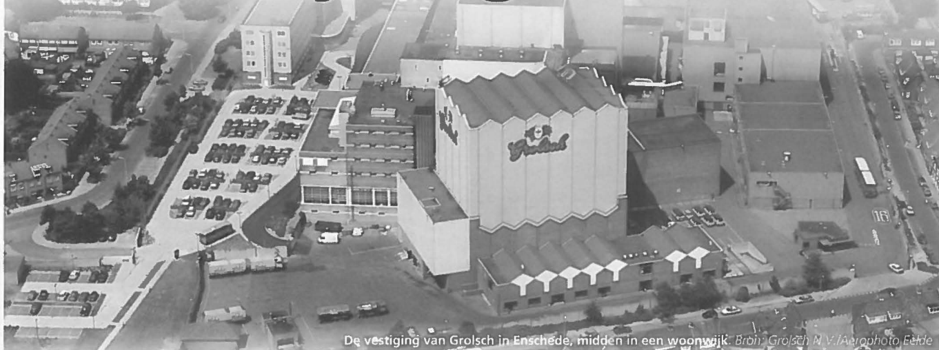
De vestiging van Grolsch in Enschede, midden in een woonwijk.

In 2003 rolt het laatste biervat uit de vestiging van Grolsch in Groenlo. De bierbrouwer gaat alle activiteiten bundelen op het -nog aan te leggen- industrieterrein De Grote Plooi, nabij Enschede. Het einde van een traditie.