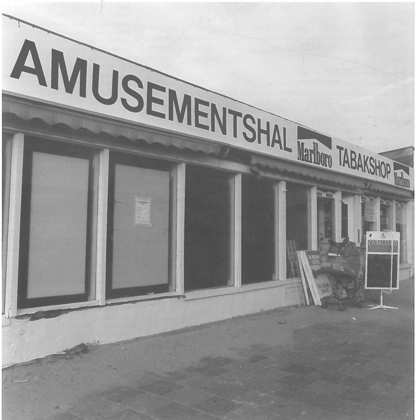
Permanente en semi permanente bewoning fixeren de kust.

dediging waaraan dergelijke nadelen kleven. Met het voorbeeld rond Vlieland is dit treffend te illustreren. De voortdurende reactie van de zee op het bouwen van strandhoofden, de eer-