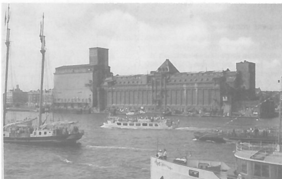
De Graansilo's als decor voor Sail Amsterdam.