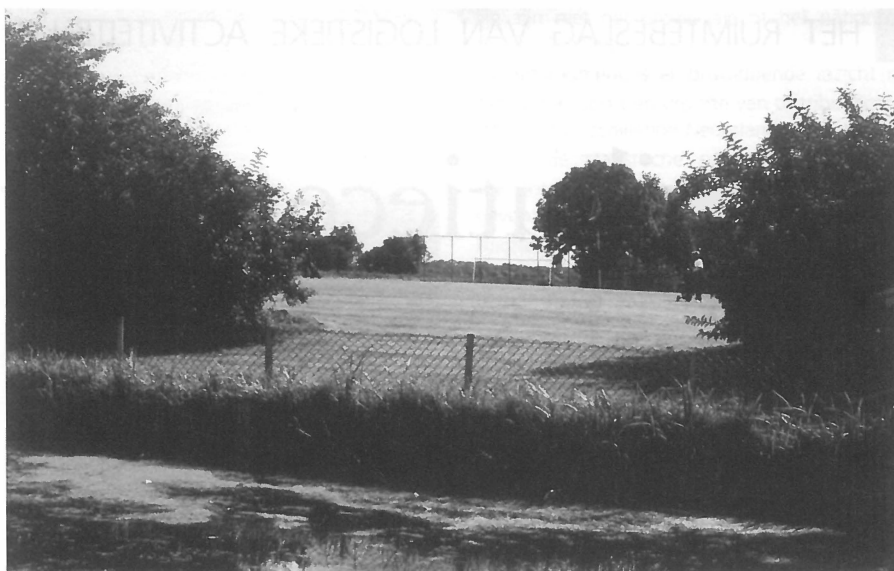
Traditionele activiteiten worden uit het landschap verdrongen.

nieuwe activiteiten, die niet alleen meer gebruikt worden voor landbouw- en voedselproductie. Deze activiteiten zijn gericht op recreatie, toerisme, zorgboerderijen, natuurbeheer, milieu- en waterbeheer, verwerking van producten op het bedrijf en de ontwikkeling van streekproducten. De boeren en boerinnen maken hierbij gebruik van hun kennis en van bestaande bronnen als grond, gebouwen, arbeid en kapitaal. Om deze bronnen te behouden en het cultuurlandschap te beschermen is het van belang de agrariërs te subsidiëren, want plattelandsonderhoud is agrarisch vakmanschap. Daarnaast is het mogelijk om op basis van deze 'license to produce' andere doelstellingen dan de schaalvergroting te verwezenlijken. Duurzaamheid, kwaliteit en biologische teelt sluiten naadloos aan bij de bescherming van het cultuurlandschap. Daarom is het de moeite waard de boer een passende beloning te geven als beschermer van het landschap.