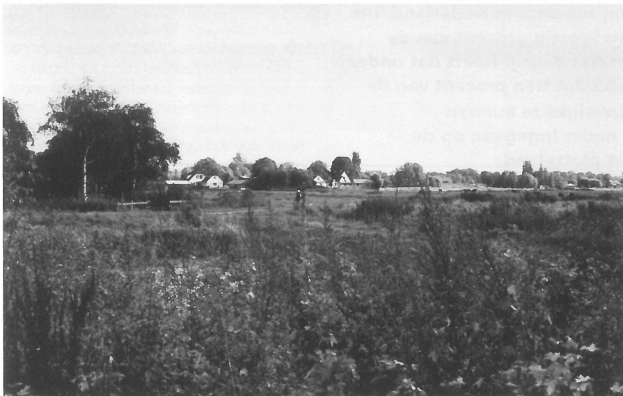
Natuur en recreatie zijn belangrijk voor de nieuwe plattelandsbewoners.

We hebben geconstateerd dat de inkomens van boeren en tuinders achteruit gaan. Er is vastgesteld dat armoede in de landbouw geen onbekend verschijnsel meer is. We hebben de conclusie getrokken dat armoede kan leiden tot afbraak van het cultuurlandschap en wij verbinden daaraan de subjectieve gevolgtrekking dat hierdoor het platteland zal veranderen en wellicht zal verpauperen. Het huidige beleid van het Ministerie van LNV geeft weinig reden tot juichen. Schaalvergroting is nog steeds het toverwoord in Den Haag. De minister laat geen spreekbeurt voorbij gaan of hij wijst erop dat de boer als een ware 'homo economicus' zijn bedrijf dient te verkopen en stil moet gaan leven. Het gezegde 'de boer is arm en sterft rijk' wordt door velen onderschreven. Toch ligt een oplossing voor de hand. Er dient, plechtig geformuleerd, een nieuw sociaal contract tussen landbouw en samenleving te worden afgesloten. Dit contract dient de collectieve aspecten van de agrarische sector te onderstrepen. Het gaat om het behoud van de natuur, het cultuurlandschap en een belangrijk deel van de plattelandssamenleving. Voor dit behoud dient de overheid een passende beloning te geven. Rond de boerderij ontwikkelen vele agrariërs