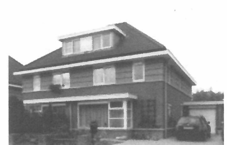
Kitscherige droomhuizen met puntdak op Ockenrode.