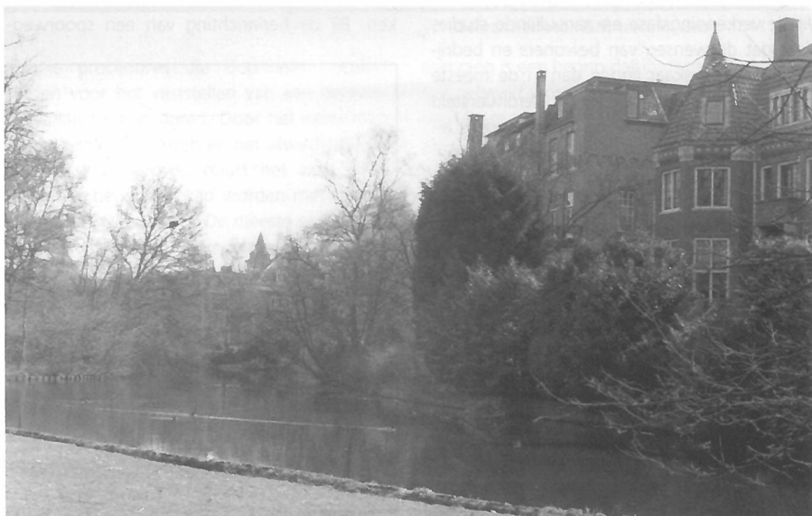
Stedelijk wonen in het groen.