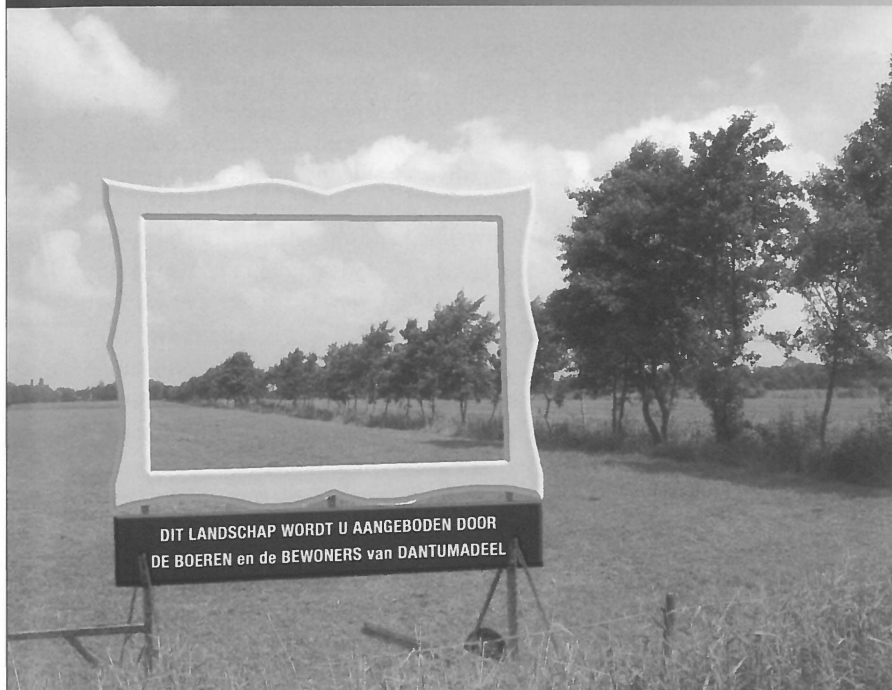
Dantumadeel denkt na over een nieuw dorp.

sociale problematiek van het gebied. Dit is toch wel een van de belangrijkste pijlers van nieuwe dorpen. De Blauwe Stad zoekt draagvlak in plaats van mensen zelf aan het denken zetten. Het past echter wel degelijk in de 'familie' omdat gekeken wordt naar de vraag hoe anders om te gaan met vrijkomende grond. De recente aanpassingen in het te realiseren woningbouwprogramma als gevolg van de wijzigende vraag dient ook in het licht van de huidige conjunctuur gezien te worden. Dat kan over vijf jaar wel weer geheel anders zijn."