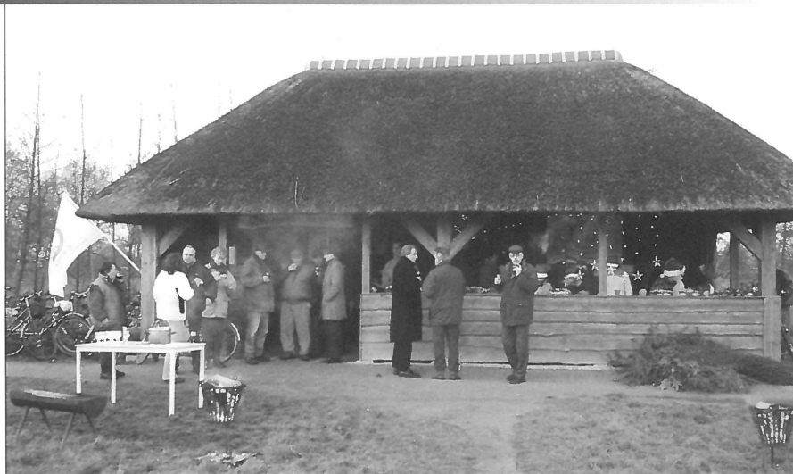
Kerst in Kornhorn.

Vaker zie je functiemenging op kleinere schaal van (water)recreatie met het agrarisch bedrijf, zoals poldersport in een boerenbedrijf in het Zuid-Hollandse Kamerik. Groepen recreanten komen er onder professionele activiteitenbegeleiding een soort tienkamp doen met activiteiten zoals tobbedansen in de sloot, een wedstrijdje koe melken, een vlot maken en zaklopen in de wei. Een andere verweving is recreatie met natuur- of landschapsbeheer zoals in het Groningse kerkdorp Kornhorn. Staatsbosbeheer richtte er samen met dorpsbewoners een aangrenzend natuurgebied in met wandelpaden voor recreanten, een natuurwerkschool voor scholieren en een ontmoetingsplek voor dorpelingen. Er liggen inmiddels plannen voor een multicultureel centrum dat niet alleen dienst kan doen als les-, ontmoetings- en ontvangstruimte, maar ook ruimte biedt aan dokter en apotheker, Internetgebruikers, verenigingen en cursisten. Dat is een duidelijke aanvulling van de sociale infrastructuur voor bewoners en bezoekers. De bovenstaande voorbeelden van de huidige praktijk van dorpsvernieuwing laten zien dat dorpsbewoners gebaat zijn bij de komst van bezoekers, vanwege effecten op werkgelegenheid en op behoud van cultureel erfgoed, landschappelijke identiteit en voorzieningen zoals de laatste dorpswinkel. In de discussies en ontwerpen rond de metafoer 'nieuwe