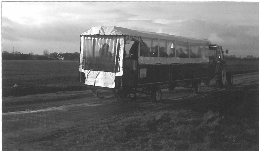
Winnaar van de dorpsvernieuwingsprijs 2003 te Wijster.

Illustratief voor vooral de economische waarde van recreatie zijn dorpen die met een thema hun historische of anderszins waardevolle attracties, cultuurlandschap, winkels en uiterlijk profileren. Zo staat het Friese Terherne inmiddels bekend als Kameleondorp. De Kameleon is het bootje waarin de tweeling Sietske en Hielke in het dorp Lenten in de jaren vijftig allerlei avonturen beleefden. Hotze de Roos, auteur van de gelijknamige kinderboekenreeks, liet tijdens een bezoek aan Terherne eens vallen dat het er best leek op dat fictieve dorp. Bij al bestaande