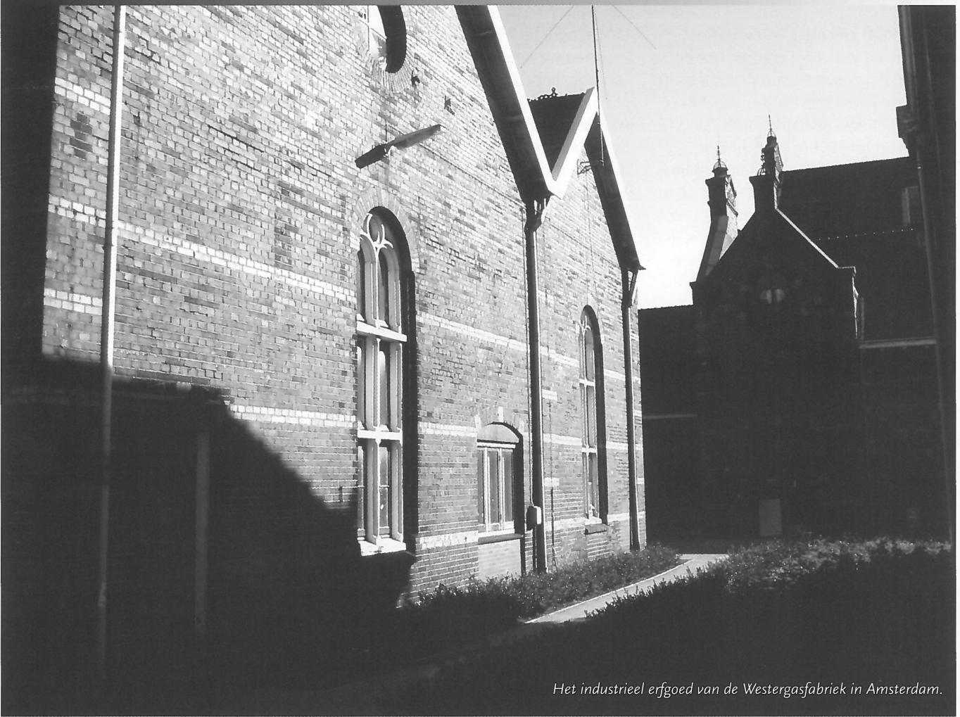
Het industrieel erfgoed van de Westergasfabriek in Amsterdam.