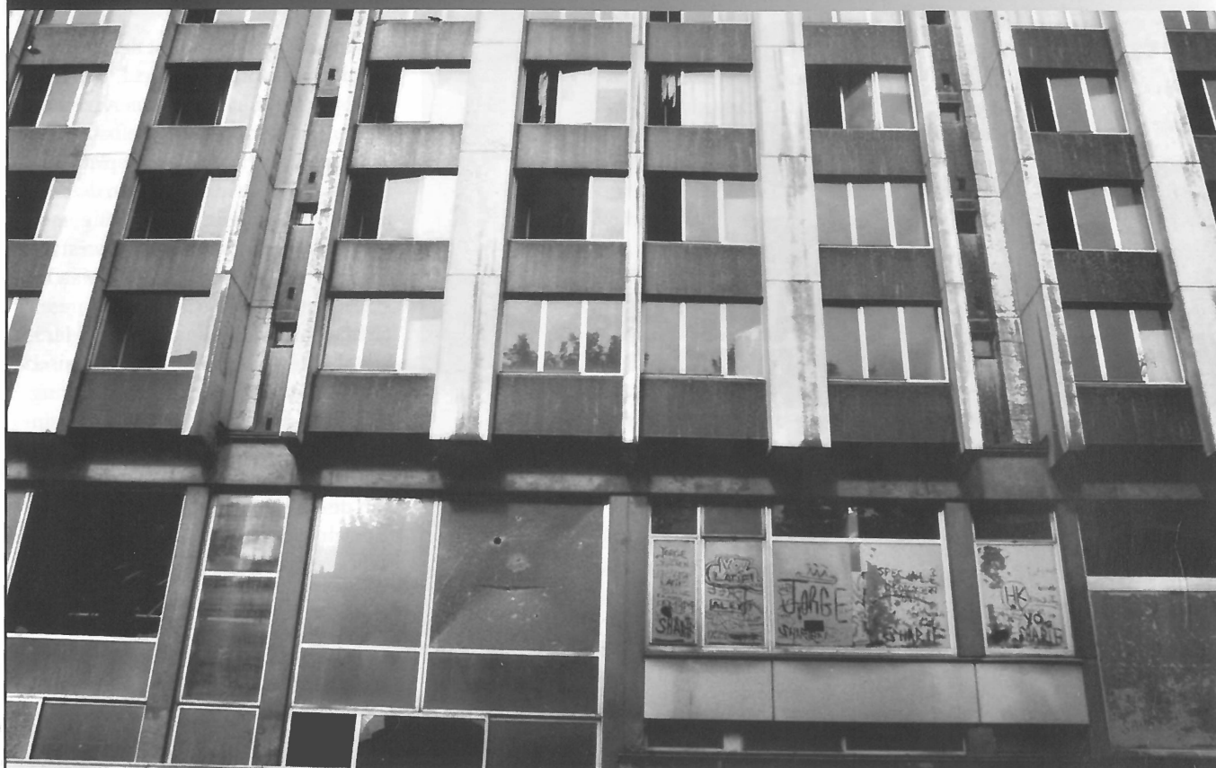
Braakliggend pand aan de Boulevard Albert Camus, Sarcelles.

ingrijpen van de staat. Overigens verschafte dit stedelijk beleid, met haar specifieke ruimtelijk vocabularium dat de stad strikt scheidt van de banlieue, de ruimtelijke metaforen die deze republikeinse consensus kunnen ondersteunen en het mogelijk maken om over immigratie te spreken zonder het woord in de mond te nemen. De ruimtelijke beeldspraak die het stedelijk beleid al jaren gebruikt, maakt het nu mogelijk de banlieue als een bedreiging te zien voor de integriteit van de Franse cultuur en samenleving.