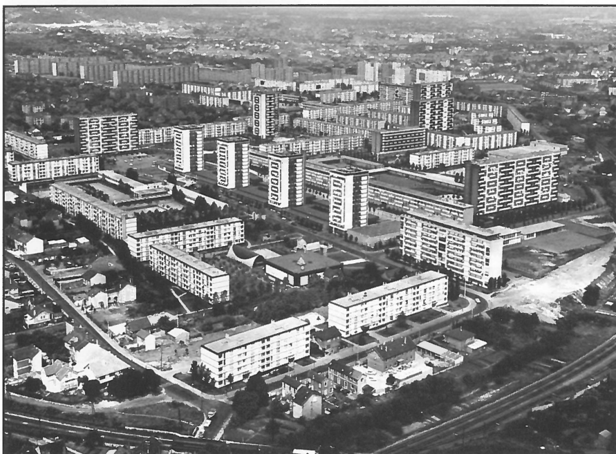
Epinay sur Seine, Seine-Saint-Denis, Parijs.

In de jaren tachtig ziet men een verschuiving in het denken van de republiek ten opzichte van vreemdelingen. Men is getuige van een herleefd 'republikeins nationalisme', vooral voelbaar op het vlak van onderwijs en immigratie. Maar ook in het stedelijk beleid is dit republikeins nationalisme voelbaar, met name in haar obsessie met culturele verschillen, die de republiek zouden bedreigen en in haar nadruk op de noodzaak voor een autoritair, repressief