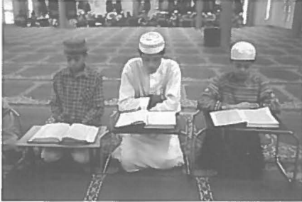
Biddende Pakistaanse Moslims in Amsterdam Zuidoost

werelden zijn: "Het Islamitische geloof is niet een zo'n bindende factor dat er gezamenlijke moskeeën worden gebouwd. Ook tijdens het vrijdaggebed zie je in een Turkse moskee nauwelijks een Marokkaan en vice versa". Zo hebben de moskeeën in Amsterdam ieder hun eigen nationaliteit: er zijn nu elf Turkse, vijftien Marokkaanse, vier Surinaamse, één Egyptische