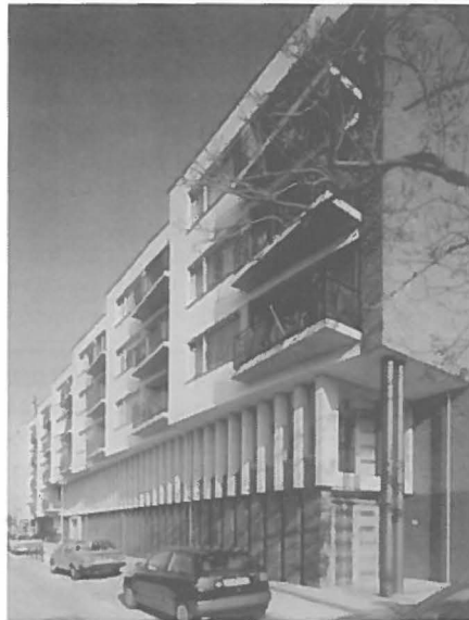
De nauwelijks als zodanig te herkennen moskee in Amsterdam Oost.

schappen gedaan kan worden. Daarnaast bevindt zich vaak een kapper in de moskee en wordt het gebouw dikwijls gebruikt als theehuis met mogelijkheden voor tafeltennis en biljart en als ruimte voor feesten. Verder is er veelal een logeerruimte voor binnen- en buitenlandse leraren en gastsprekers aanwezig. In sommige moskeeën is een mortuarium opgenomen. Voor de bouw van een moskee gelden maar enkele voorschriften die direct voortkomen uit de Islam. Vandaar dat de verschijnings-