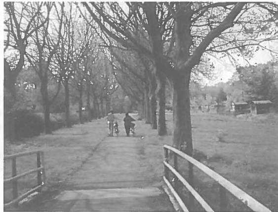
"Een groot gedeelte van het park wordt in beslag genomen door volkstuinen"

voorbeeld door het aanleggen van meer openbare sportvoorzieningen in het park zelf. Sommige sportverenigingen hebben namelijk overlast van voetballende jongeren op hun velden. Een voetbalvereniging