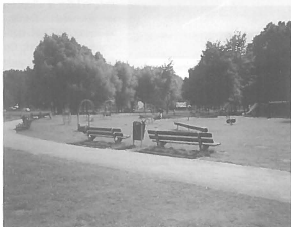
"Zuiderpark heeft te weinig hoofdmomenten"

Het Zuiderpark is een uitgestrekte groengebied van ruim twee kilometer lang en een kilometer breed, gelegen in het centrum van het zuidelijke gedeelte van Rotterdam op de linker Maasoever. Dit is op het oog een centrale lokatie, dichtbij het winkelcentrum Zuidplein en Ahoy, en goed bereikbaar per metro. Zo'n honderd-duizend mensen wonen in de directe omgeving van het park. Toch is het park relatief on-