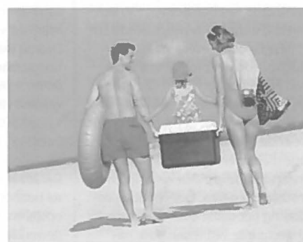
"Waterrecreatie neemt een belangrijke plaats in"

tweeverdieners met kinderen, hetgeen vergelijking van de resultaten van het onderzoek moeilijk maakt. Een andere moeilijkheid is dat diverse bestaande statistieken over dit onderwerp elk eigen definities hanteren. Bij een zeer globale vergelijking met cijfers van het Dagrecreatie-onderzoek van het Centraal Bureau voor de Statistiek (CBS), komen toch enkele verschillen naar voren. Hierbij moet worden opgemerkt dat het CBS geen specifieke doelgroep hanteerde. Het meest opvallende verschil met de CBS cijfers is het hoge aandeel fun bij de ondervraagde tweeverdieners met kinderen en het lage aandeel stedelijke recreatie. Daarnaast vertonen de respondenten een hoge mate van deelname aan waterrecreatie, maar de verklaring hiervoor kan liggen in de invloed van de woonomgeving van de onderzochte tweeverdieners met kinderen. Een mo-