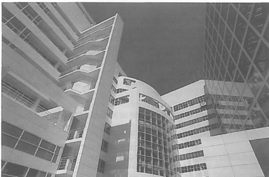
Het door Richard Meier ontworpen stadhuis van Den Haag.

Was er twintig jaar geleden dan ook al zoveel aandacht voor architectuur als visitekaartje, bijvoorbeeld bij gemeenten bij het