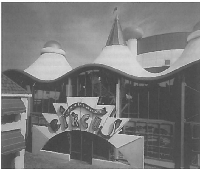
Circus Zandvoort: een gokpaleis in een tent met kolossale vlaggen erop.

Het is duidelijk dat de doelstelling om gebouwen te maken, die vooral het imago van de opdrachtgever en gebruiker uitstralen, om een andere