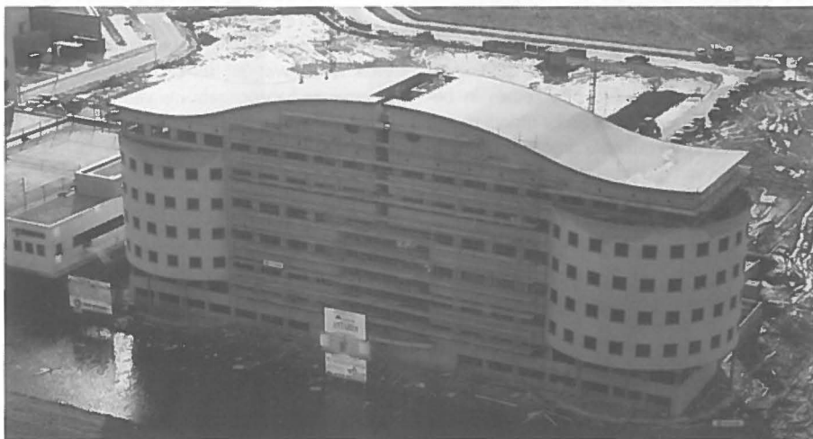
Antaresgebouw in aanbouw.

Het Antaresgebouw in Beukenhorst-Oost is een project dat in goed overleg en samenwerking tussen de gemeente en de projectontwikkelaar