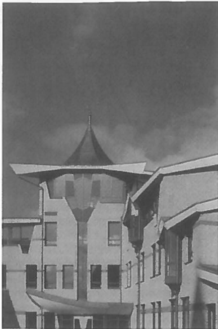
Gemeentehuis Genneep.