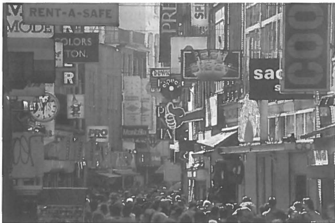
Het stadshart van Amsterdam vertoont (onvermoede) kracht.

In de afgelopen decennia hebben veel steden, vooral in de Verenigde Staten, hun stadskernen in kracht zien verminderen. In dezelfde periode is het de Amsterdamse binnenstad gelukt een geheel eigen, belangrijke plaats te behouden in de stedelijke