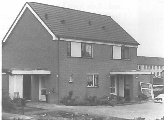
Nederland massaal aan de 'tweekkappers'?

Het 28e Internationale Geografisch Congres zal volgend jaar van 4 tot 9 augustus in Den Haag worden georganiseerd. Het hoofdthema zal zijn 'Land, zee en menselijke inspanning'. Het brede thema garandeert interessante onderwerpen voor eenieder die zich wetenschappelijk of professioneel bezighoudt met mens en omgeving. Het congres zal worden georganiseerd in een nieuwe vorm: alle