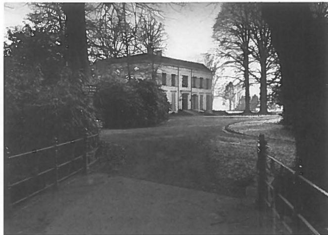
Hoofdverblijf in parkachtig landschap, en een tweede huis inde stad?

gen, die jaarlijks worden uitgebracht, zijn vier visies opgenomen, die een opstapje vormen voor de in 1997 uit te brengen "Verkenning Ruimtelijke Perspectieven", waarmee de voorbereiding voor nieuw ruimtelijk-orde-