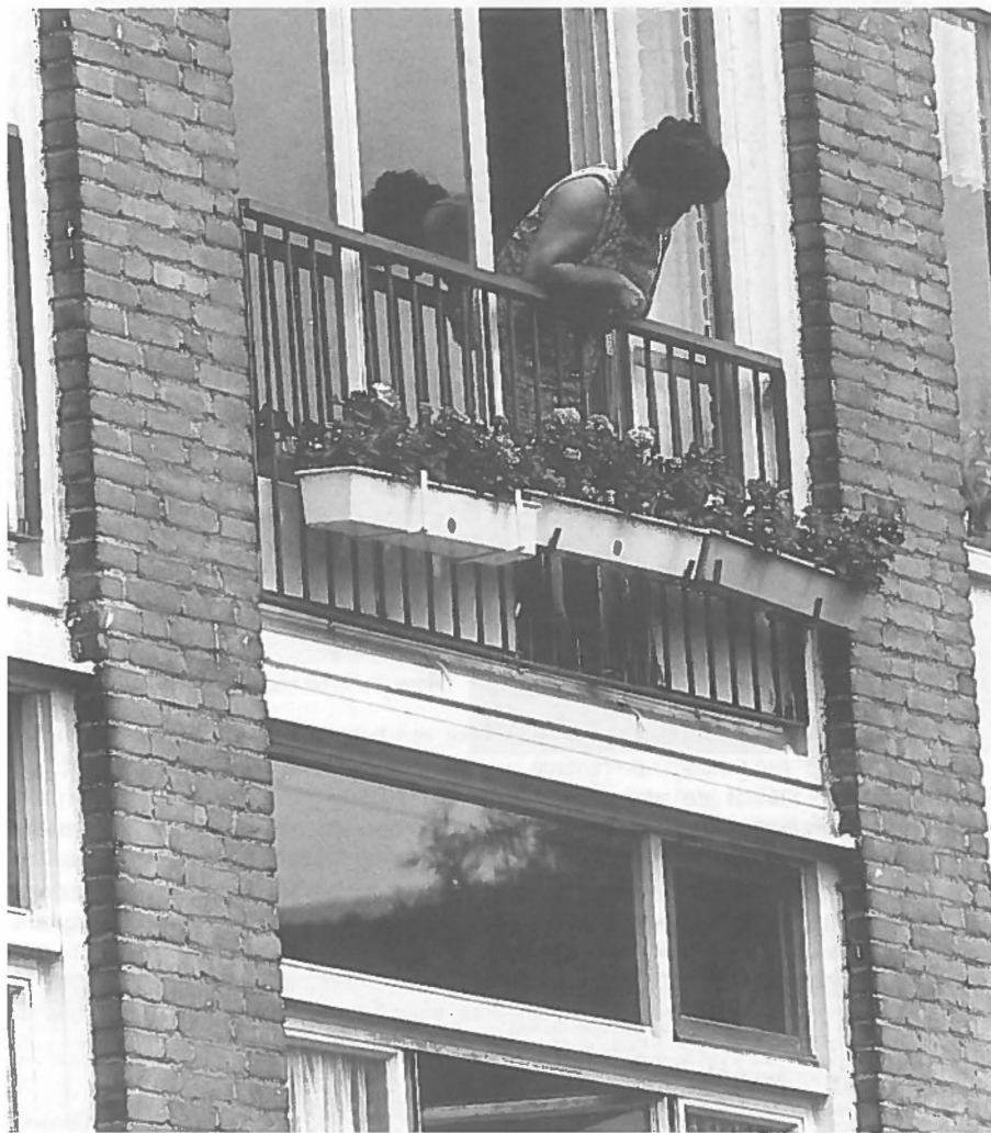
Door het overlijden van partners komen vooral veel vrouwen alleen te staan.

Deze ontwikkeling heeft directe implicaties voor het woningbouwbeleid. Aangezien de