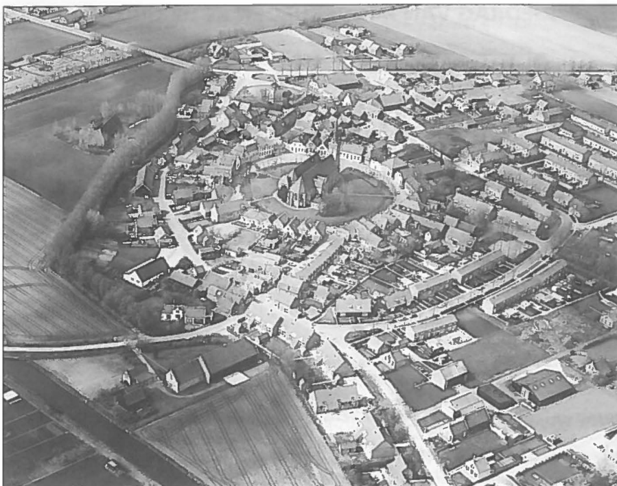
Kernen moeten mooi blijven.