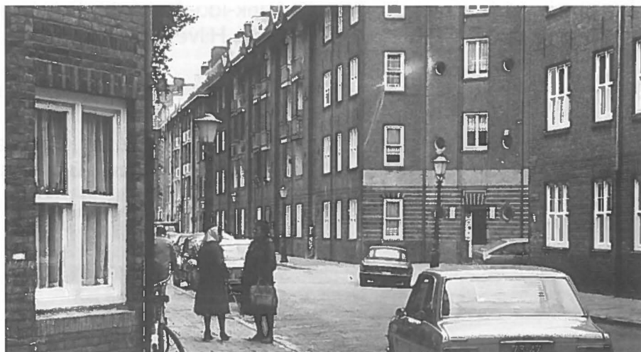
Amsterdammers in wijken met veel migranten hebben minder vooroordelen.