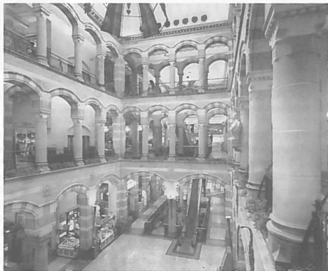
Het voormalig hoofdstation in Amsterdam is herontwikkeld tot een overdekt shoppingcentre.

Binnensteden hebben in toenemende mate te kampen met een uitholling van hun winkelapparaat. Een slechte bereikbaarheid en beperkte parkeermogelijkheden liggen hier traditioneel aan ten grondslag. Tegelijkertijd neemt de concurrentie met suburbane kernen, stadsdeelcentra en grootschalige detailhandelconcentraties toe. Een belangrijk vraagstuk is daarom hoe binnensteden hun vitaliteit en aantrekkingskracht kunnen behouden. In de publikatie Het behoud van de binnenstad als winkelhart wordt dieper op dit vraagstuk ingegaan. De publikatie bevat een bewerking van bijdragen aan een symposium over dit thema, dat in