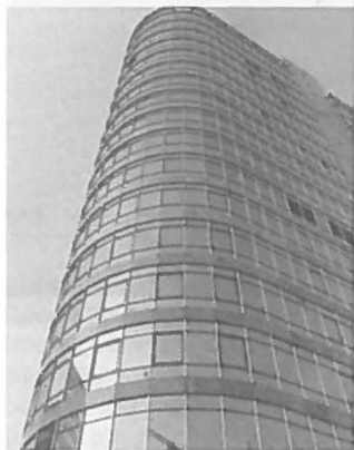
De kantorenmarkt trekt weer aan.

De kantorenmarkt trekt weer aan. Naar verwachting zal de vraag naar kantoorruimte stijgen. De situatie en wensen van de gebruikers t.a.v. het