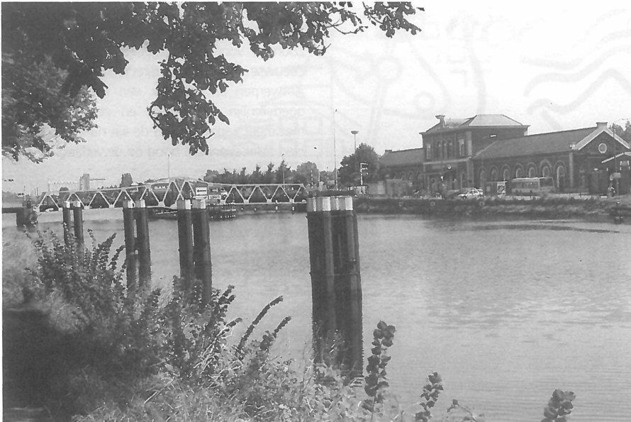
Het stationsgebied langs het kanaal door.

Hoewel in de vakantieperiode het aantal bewoners van Walcheren verdrievoudigt ten opzichte van de rest van het jaar, is het rustig in Middelburg. Een paar handenvol Belgen, Duitsers en Nederlanders bekijken de beeldtentoonstelling op de binnenplaats van de abdij, een enkeling beklimt de toren "Lange Jan" ("uitzicht op het Walcherse land tot aan de duinen"). De paarden die vanaf het monumentale stadhuis een kar met dagjesmensen door de stad moeten voorttrekken staan werkloos op passagiers te wachten.