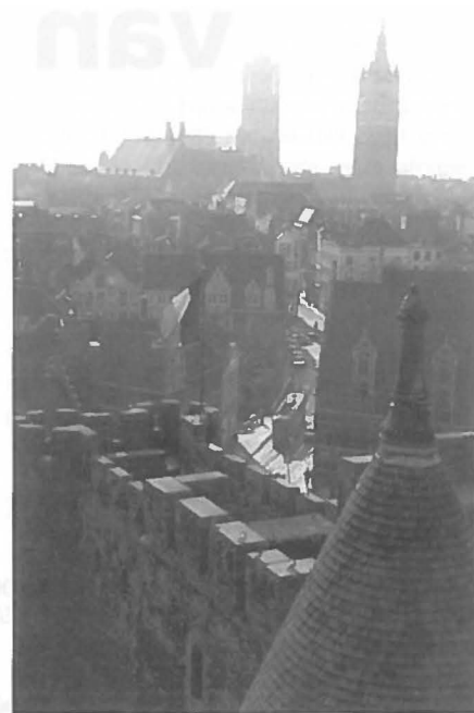
Antwerpen: op een steenworp afstand.

Vooraf het groeiende wegverkeer vraagt om een beleid, waarin veel aandacht uitgaat naar de locatie van mobiliteit genererende activitei-