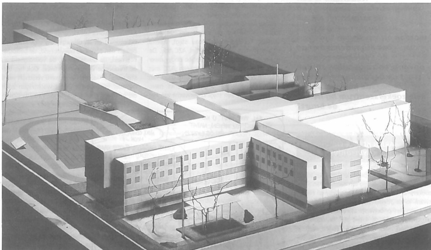
Penitentiare inrichting Zoetermeer op maquette.

Het Nederlandse gevangeniswezen is bezig met een grote inhaalslag. Vijftien april jongstleden opende minister Sorgdrager van Justitie zes nieuwe penitentiare inrichtingen. Hiermee is Nederland in één keer ruim 1600 cellen rijker. Waar zijn deze nieuwe gevangenis­sen gebouwd en hoe komt de locatie­keuze van straf­inrichtingen eigenlijk tot stand?