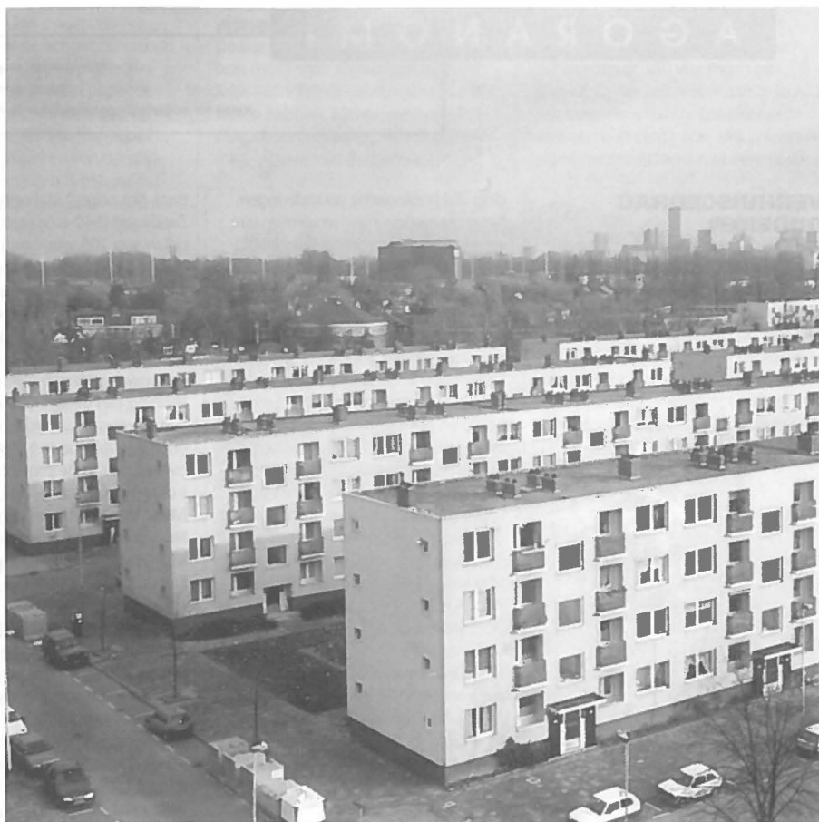
Kleinpolder in Rotterdam.

De vraag is nu of de onveiligheidsgevoelens zich direct richten op de buitenlanders, of op het verdwijnen van de vertrouwdheid van de