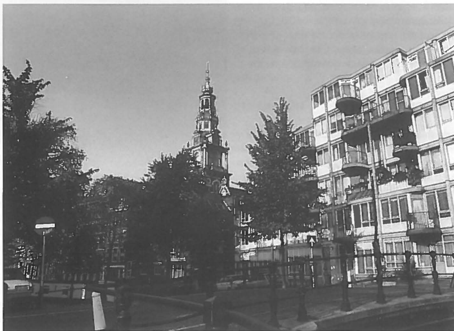
Nieuwbouw inpassen in de bestaande structuur is niet altijd even makkelijk (Amsterdam).

houden en met aangepaste middelen het bestaande beeld te laten voortbestaan. Soms wordt zelfs gepoogd het beeld uit een vroegere periode terug te halen. Afsluiting van toekomstige ontwikkelingen is misschien niet zozeer