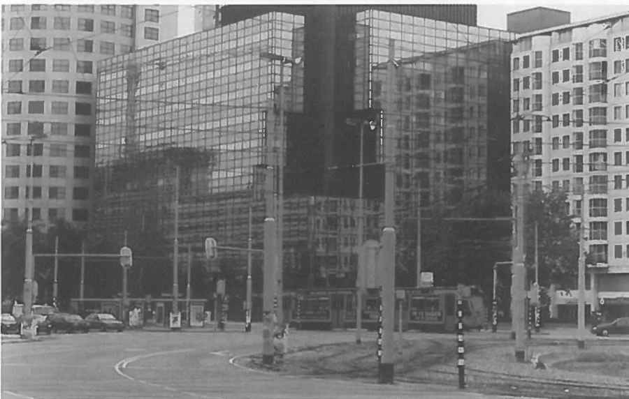
Economische welvaart schijnt uitgedrukt te moeten worden in overwoekerende spiegelglas-architectuur (Rotterdam).

*De auteur is afgestudeerd als planoloog aan de Universiteit van Amsterdam. Dit artikel is gebaseerd op haar doctoraalscriptie Cultuurhistorische waarde(ring) in de ruimtelijke ordening . Thans is zij tijdelijk werkzaam als assistent-researcher bij een consultancy bureau in Brussel.