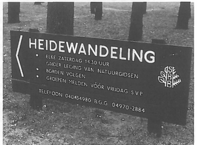
Spanning tussen natuur en toerisme/recreatie (Strabrechtse heide).

Voor meer informatie of een abonnement: Samson Klantenservice, tel. 01720 - 66 822