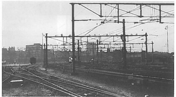
Consequenties voor netwerkstructuur. archiefphoto

Meer informatie: KUN, afd. Pers & Voorlichting, tel. 080 - 61 60 00