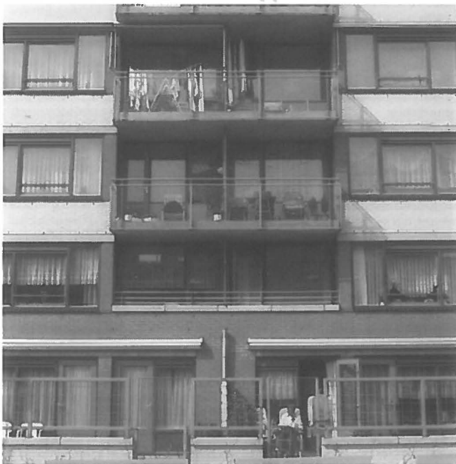
Needham: Groene ruimte behouden door hogere dichtheden in de compacte stad.

De Zuiderkerk, Zuiderkerkhof 72, Amsterdam; tel. 020 - 622 29 62