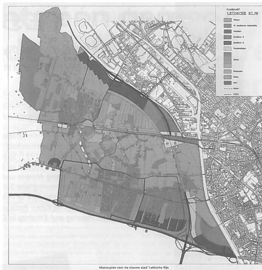
Masterplan voor de nieuwe stad 'Leidsche Rijn'

De fasering van de aanleg is voor de sport- en recreatievoorzieningen van groot belang. Uitgangspunt is dat voorzieningen gelijk met de woningen gerealiseerd worden. Ook zullen nieuwe complexen gereed moeten zijn voor dat bestaande, te verplaatsen sportvoorzieningen in het plangebied, ontruimd kunnen worden ten behoeve van woningbouw of aanleg van infrastructuur. Al met al is de planning en realisering van veel ruimte eisende voorzienin-