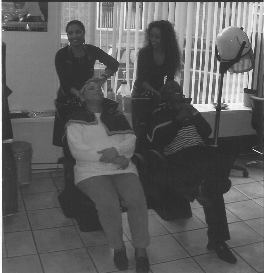
De hechte sociale netwerken stellen migranten vaak in staat een eigen bedrijf te starten.

competenties, gereedschappen, transportmogelijkheden en contacten met potentiële klanten. En werkenden beschikken dankzij hun arbeidspositie over dergelijke capaciteiten en mogelijkheden, vaker dan degenen die buiten het formele arbeidsproces staan. Vandaar dat deze laatste categorie weinig profijt lijkt te hebben van de informele economie. Zo draagt de informele economie bij aan een verdere polarisatie tussen 'work-rich' en 'work-poor' huishoudens.