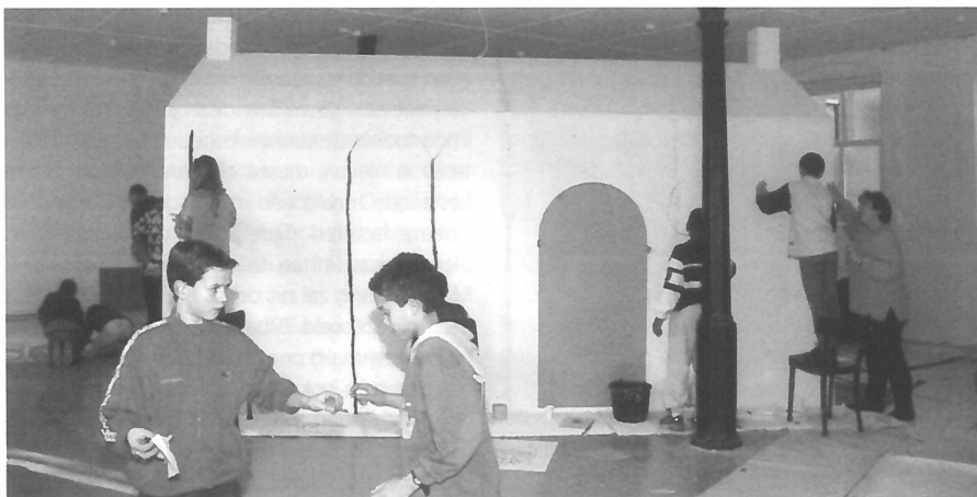
Het mini-lokaal 01 huisje.

Het Overburen-project zou moeten voldoen aan bepaalde vooraf gestelde eisen. De mensen moesten worden ondersteund in plaats van te worden gepushed om te participeren. Daarnaast moest het project voldoende ruimte bieden aan de verschillen en diversiteit tussen de burenen. De laatste en tevens de moeilijkste eis, was dat de mogelijk opgetreden verandering in hoe mensen naar elkaar kijken en met elkaar omgaan, zou moeten standhouden, ook als het project beëindigd was. De verandering zou