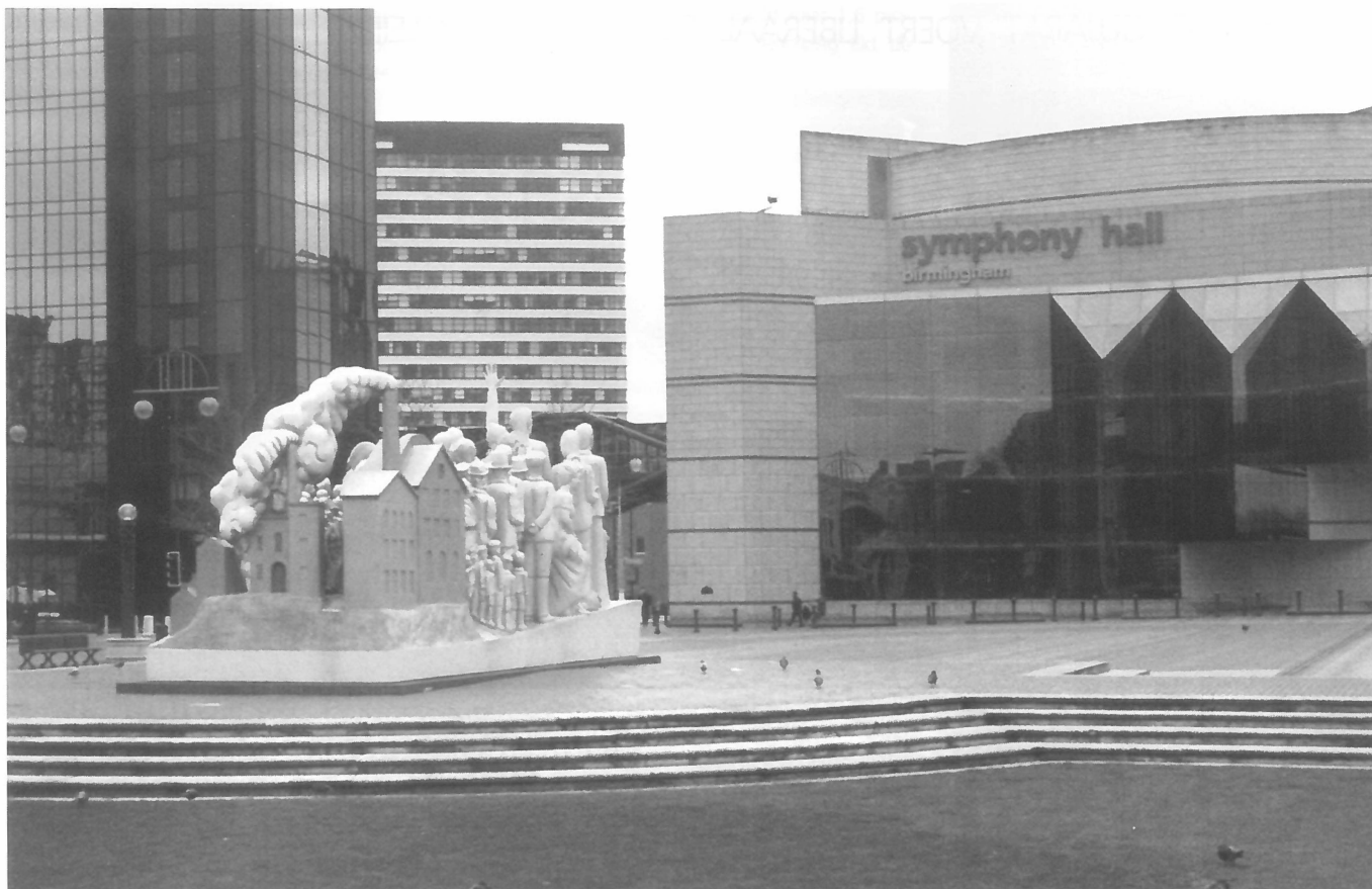
The Symphony Hall.

investerings in het neerzetten van de vernieuwde infrastructuur, ook de lasten te dragen van het onderhoud van deze infrastructuur. Dit begint meer een druk te worden nu de laatste jaren veel nieuwe projecten zijn gerealiseerd met behulp van gelden die zijn verkregen vanuit de opbrengsten van de staatsloterij, die vervolgens weer onderhouden moeten worden door de gemeente. In eerste instantie ging het loterijgeld vooral naar Londen en naar de grote projecten (bijvoorbeeld Bernard Haitinks Royal Opera House : 75 miljoen pond). Later was Birmingham ook succesvol, onder meer met loterij-bijdragen, voor meer alternatieve vormen van cultuur.