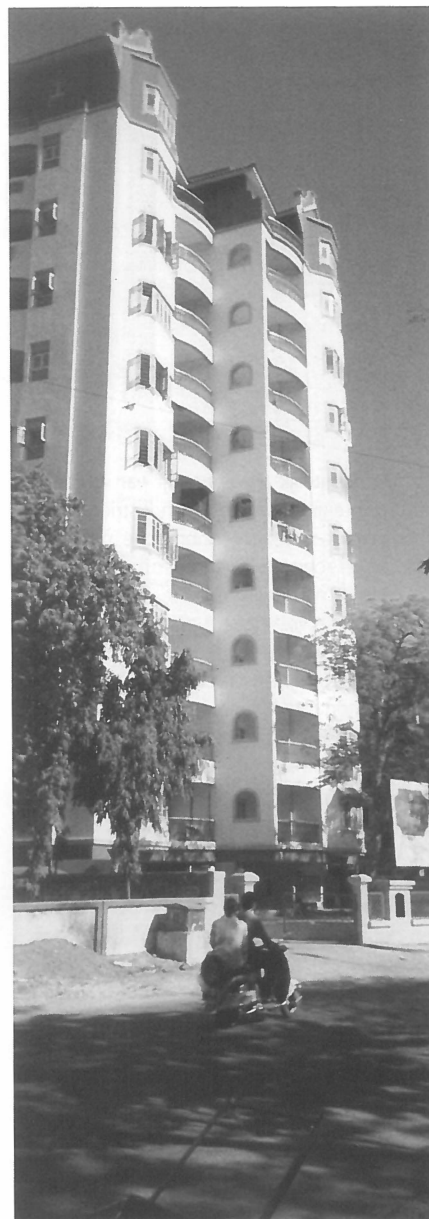
Fraaie nieuwbouw in West-Ahmedabad.

heeft dit initiatief geleid tot een veel groter bewustzijn, zowel bij de burgers als bij de overheid, van het belang van een streng milieubeleid om de dynamische industriële sector in de staat enigszins in toom te kunnen houden.