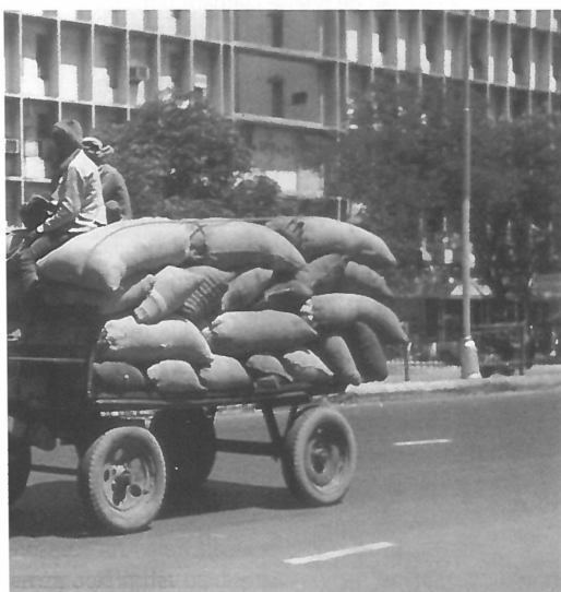
De traditie en het moderne samengaan.

In een van die fraai vormgegeven gebouwen is de School of Planning gevestigd. De economische voorspoed en moderne uitstraling zijn de studenten gelukkig niet naar het hoofd gestegen. Zij zijn oog blijven houden voor maatschappelijk relevante onderwerpen. Een greep uit de gekozen onderwerpen om op af te studeren laat dit zien: de samenhang tussen inkomensniveaus en ziekten in krottenwijken in Calcutta, de spreiding van vervuiling in Indiase deelstaten en de districten van Gujarat en moeten we tigers of landlozen beschermen in dit land? De gesignaleerde gunstige ontwikkelingen nemen niet weg dat de deelstaat Gujarat evenals de rest van India nog een overvloed aan maatschappelijke problemen kent. Economen hebben het vaak over Hindu growth . De economie groeit met drie procent per jaar, maar de bevolking ook. In per capita termen gaat een land er dan niet op vooruit. Dat was enigszins overdreven de situatie in India tot