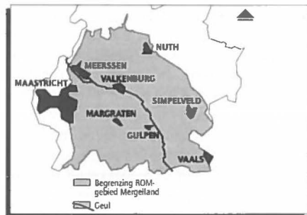
Het ROM-gebied Mergelland.

Heel concreet hoor en zie je dat als je in Zuid-Limburg en zeker in Maastricht rondloopt. Je komt er veel Fransen, Belgen en Duitsers tegen en de laatste tijd, vooral na de ondertekening van het verdrag van Maastricht, veel andere Europeanen, zoals Spanjaarden, Italianen en En-