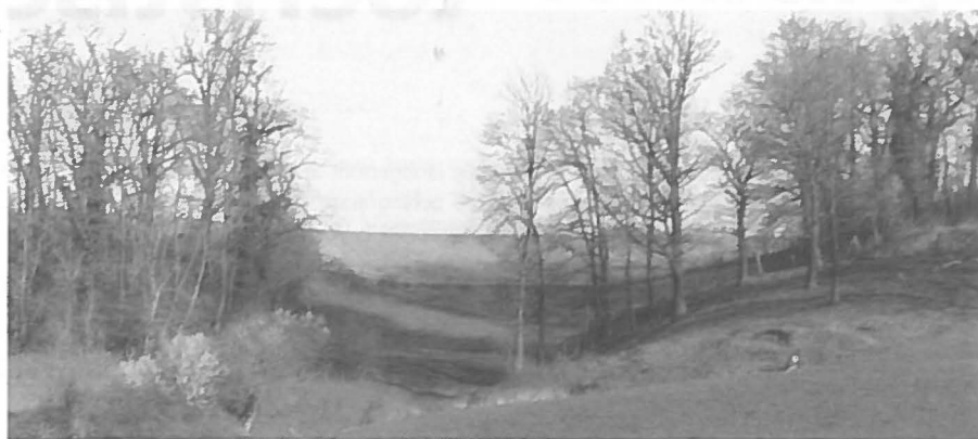
"Het landschap van Mergelland behoort tot het meest waardevolle van Nederland."

gelsen. Verder zijn er redelijk tot goede openbaar-voersverbindingen met Aken, Hasselt en Luik. En in die steden kom je dan weer veel Limburgers tegen. Het frequente internationale contact is historisch zo gegroeid. Zuid-Limburg lag van oudsher op een knooppunt van wegen.