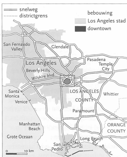
Kaart 1 - Regio Los Angeles

Dit is kortgezegd de aanleiding voor het DSP, ontworpen in 1993 door een van de architecten die kort daarna het Congress of New Urbanism zouden oprichten. Het is een ambitieus plan dat erop gericht is de centrale positie van downtown LA te versterken en het huidige verarmde en gefragmentariseerde oude centrum te veranderen in een aantrekkelijk stedelijk gebied. Het creëren van een beter imago en van de juiste fysieke settings voor investeringen staan in dit plan voorop. Belangrijke beleidsthema's zijn dan ook het verbeteren van de openbare ruimte, het aantrekken van culturele voorzieningen en het hergebruik van het stedelijke erfgoed, vooral monumentale leegstaande kantoren van voor de tweede wereldoorlog en chique oude filmtheaters. Er moet een gebied met 'traditionele stedelijke kwaliteiten' ontstaan, met klassieke boulevards, gezellige straatterrassen en cosmopolitische pleinen. De ideeën voor deze 'world class city' volgens het New Urbanism lijken afkomstig uit mediterrane Europa of de negentiende-eeuwse Amerikaanse Oostkust. Zeer opvallend is grote nadruk die wordt