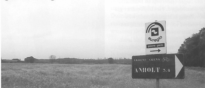
Resultaat van grensoverschrijdende samenwerking in de 'euregio'.

Geografen die zich over grensregio's buigen hebben vaak meer aandacht voor de grens dan voor de regio. Zij zijn vooral geïnteresseerd in de functie van de grens haar betekenis. Daardoor blijft de grensregio vaag gedefinieerd als de regio aan de grens. Sinds in het proces van Europese integratie grensoverschrijdende samenwerkingsverbanden gemeengoed zijn geworden, duidt men met grensregio's juist op regio's die zich over de grens uitstrekken. Onderzoek in grensregio's laat vaak zien dat het verdwijnen van scherpe staatscontroles aan de binnengrenzen van de Europese Unie niet tot de verdwijning van de grens leidt. De grens blijft een belangrijk en betekenisvolle scheidingslijn in het sociale en economische gedrag van bewoners van grensregio's. Ook hebben grensbewoners vaak weinig kennis en belangstelling voor de grensoverschrijdende politieke samenwerkingsverbanden.