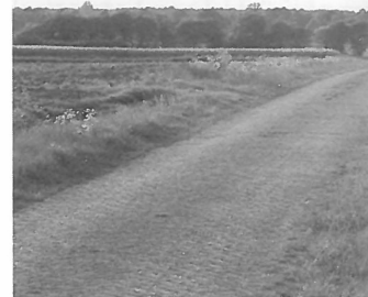
Uitzicht op het Hunze stroomdal.

maar heeft natuurlijk een regionale functie als het gaat om werkgelegenheid." Wethouder Bruintjes: „Die grens is geen gevoelde grens. Ze staat alleen op de kaart, maar is niet in de hoofden van de bevolking aanwezig. Daar speelt veel meer het onderscheid tussen zand en veen." Tussen de Groninger en Drentse veners is de sociale binding zeer nadrukkelijk aanwezig. Landschappelijke structuur en sociale verhoudingen trekken zich niets aan van bestuurlijke grenzen en zoals al vaker is geconstateerd, vallen identiteit en gemeentegrenzen niet vanzelfsprekend samen (zie Peter Castenmiller in Agora, nr.1, 2001). In dit licht bezien is het ook helemaal niet zo verwonderlijk dat de beide burens elkaar nu gevonden hebben.