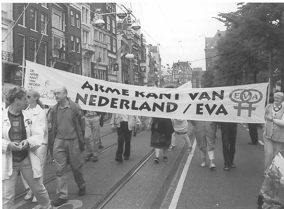
Protestmanifestatie 'De Arme Kant van Nederland'.