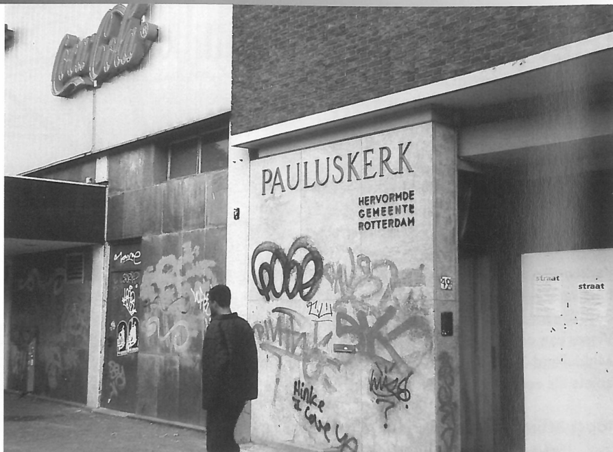
De Pauluskerk: armoedebestrijding in de hardkapitalistische samenleving.

In uw proefschrift noemt u Manuel Castells als inspiratiebron voor uw werk. Maar de ene Castells is de andere niet: zijn 'The Urban Question' (1975) was sterk Marxistisch van aard en sindsdien heeft hij een lange weg afgelegd naar zijn recente triologie 'The Information Age: Economy,