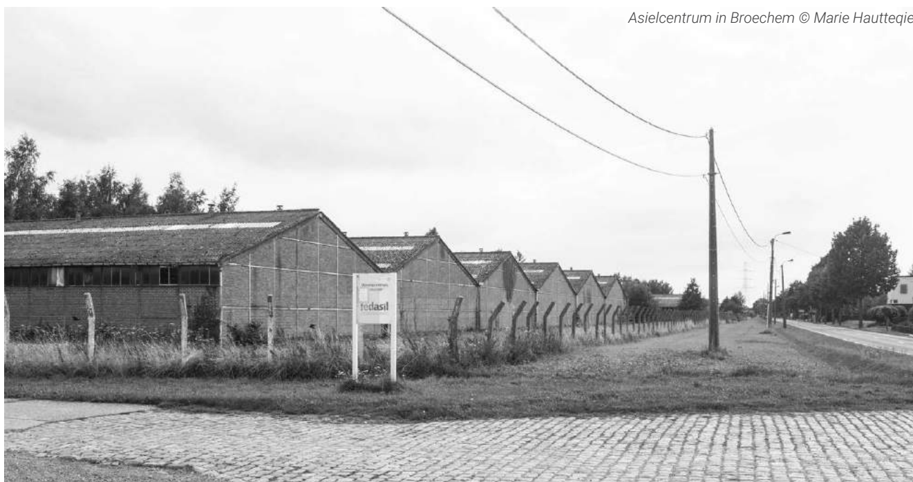
Asielcentrum in Broechem

Naast financiële middelen en overheidssteun, ontbreekt het het middenveld vandaag aan verbeeldingskracht om innovatieve woonvormen voor een diverse samenleving te bedenken. We roepen architecten en stadsplanners dan ook op een grotere maatschappelijke engagement op te nemen. HEIM ziet het als haar taak om hiervoor draagvlak te creëren in de wereld van architecten en stadsplanners en een aanspreekpunt te worden voor zij die de ambitie hebben om die rol op te nemen door hen in contact brengen met de juiste partners. Tegelijkertijd wil HEIM een platform worden voor gedeelde ruimtelijke kennis waaruit middenveldorganisaties en geëngageerde particulieren kunnen putten. We zien vandaag