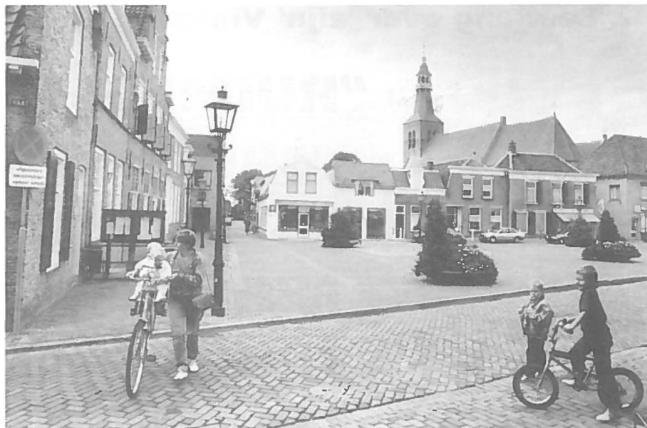
De kleine kernen op het platteland krijgen bijzondere aandacht in de Vinex. Op de foto: Sint Maartensdijk op het eiland Tholen in Zeeland.