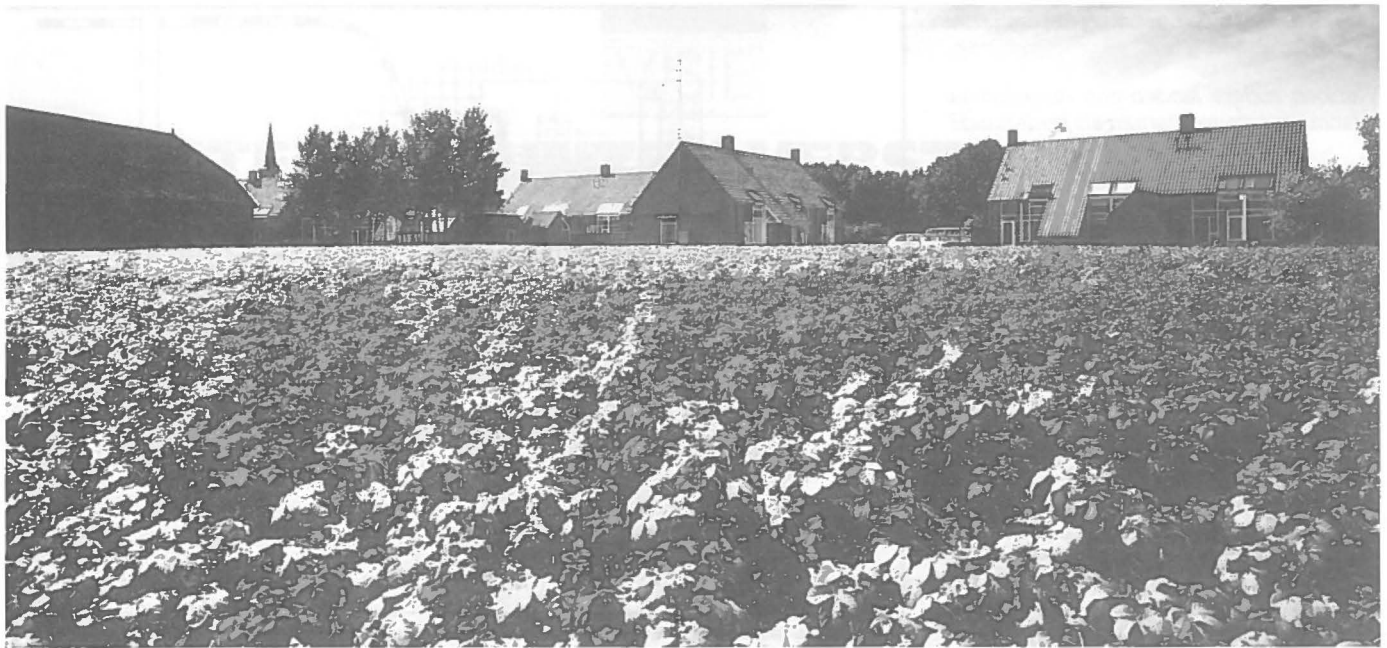
Sommige delen van het landelijk gebied dreigen een beetje door de bodem te gaan.

Ten tweede blijkt die uitvoeringsgerichtheid uit de instrumenten: zowel de ruimtelijke investeringen op macro-niveau, de geldstroom van het Rijk, de micro-strategische projecten (Kop van Zuid, IJ-oeveren) en de private sector zijn belangrijk. Een ander instrument is de bestuurlijke organisatie.