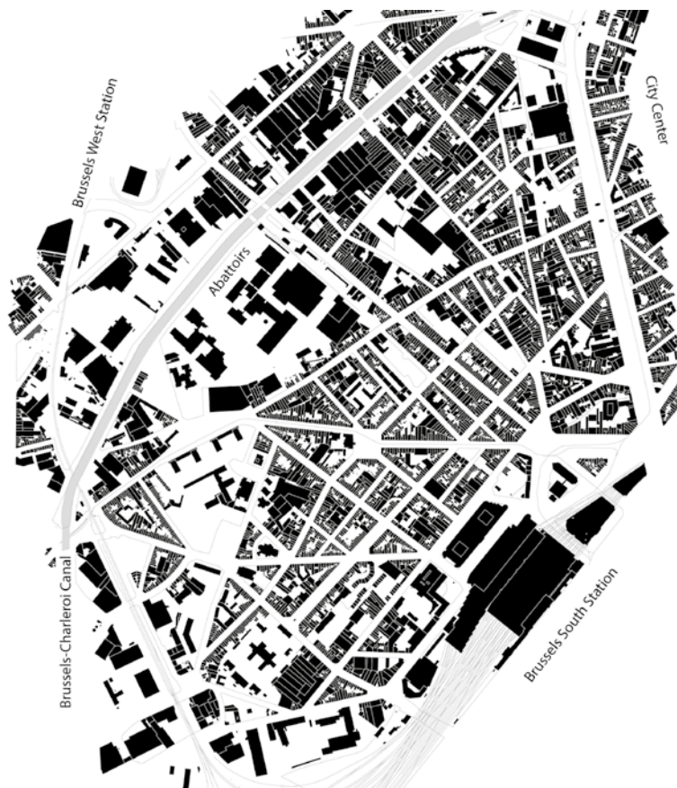
Het stedelijk weefsel van Kuregem in Brussel. Kaart: auteur.

Maar tot nu toe hebben weinig ondernemers interesse in het project getoond en het Abattoir-bedrijf heeft nog geen vastgoedpartner gevonden om de nieuwe appartementen te ontwikkelen. In tegendeel, marktkramers klagen nog steeds over de aanwezigheid van hetzelfde clientele dat alleen maar geïnteresseerd is in het goedkoopste product, waardoor de prijzen en kwaliteit van producten steeds maar afnemen. Behalve de vleesproducten die grotendeels uit het nabije slachthuis komen,